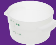
Contenedor Redondo StorPlus ™ 2 qt Mod. 1097302