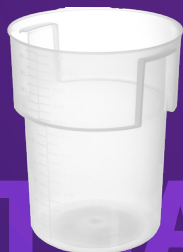
Contenedor para Baño María 22 qt Mod. 220530