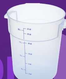
Contenedor Redondo StorPlus ™ 22 qt Mod. 1096930