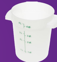
Contenedor Redondo StorPlus ™ 4 qt Mod. 1097402