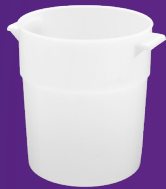
Contenedor para Baño María 3.5 qt Mod. 035002