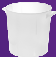
Contenedor para Baño María 6 qt Mod. 060002