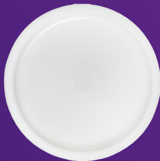
Tapa para Contenedor para Baño María 12-22 qt Mod. 120202