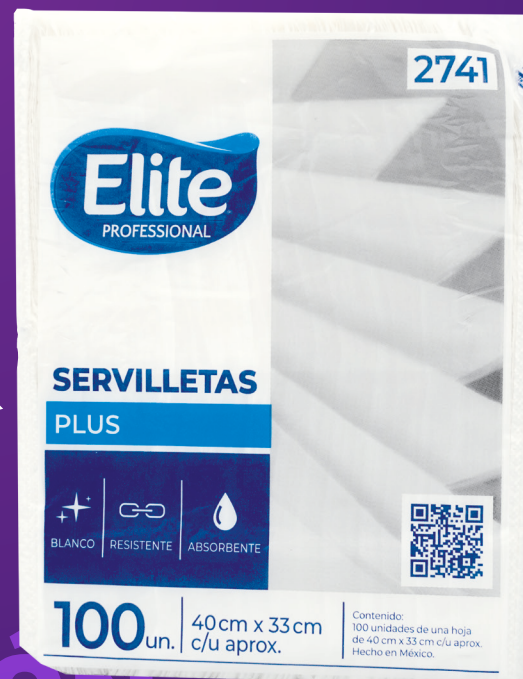
Nuevo modelo 2741 Dimensiones: 40 x 33 cm.

Se abastecerá el nuevo modelo a medida en que el inventario del modelo actual se vaya agotando.