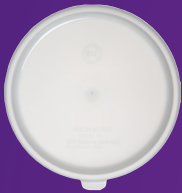
Tapa para Contenedor para Baño María 2-3.5 qt Mod. 020302