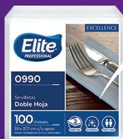
Modelo discontinuado 0990 Dimensiones: 39 x 37.7 cm.