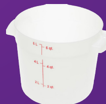
Contenedor Redondo StorPlus ™ 6 qt Mod. 1097502