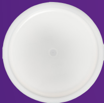
Tapa para Contenedor para Baño María 6-8 qt Mod. 060302