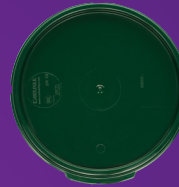
Tapa para Contenedor Redondo StorPlus ™ 2-4 qt Mod. 1077108