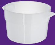
Contenedor para Baño María 2 qt Mod. 020002