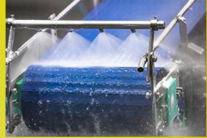
Limpieza de cintas transportadoras.