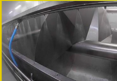
Limpieza de enfriadores giratores.