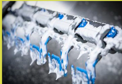
Limpieza de línea avícola.