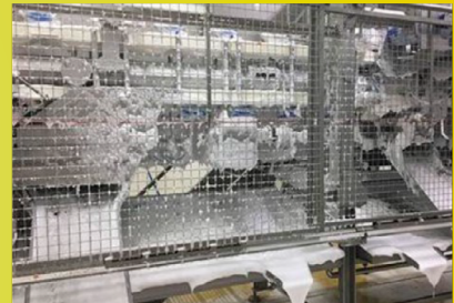
Limpieza de deshuesadora.