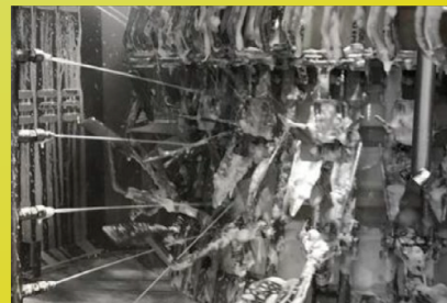
Limpieza de relleno eviscerador de aves.