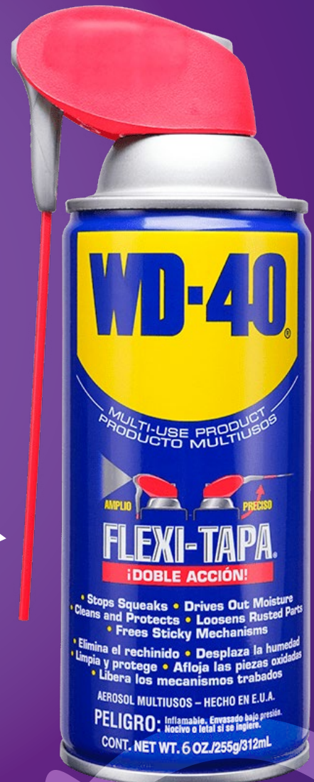
Nueva Presentación Flexitapa ® 6 oz.