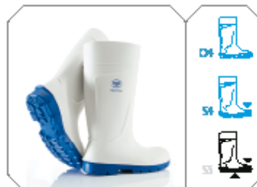
Steplite ® Food blanco - ref. P2100/1053 (O4) ref. P2300/1053 (S4)