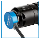
Cable de carga USB magnético MCC3 2A.