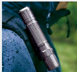
Sujetar la correa de la mochila.