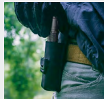
Guardar en la funda.