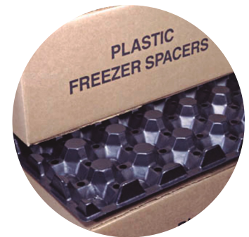
A SEPARADOR ESTÁNDAR