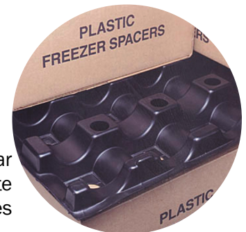
B SEPARADOR MAXI